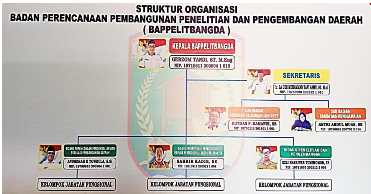
Gambar 1 Bagan Struktur Organisasi BAPPELITBANGDA Kabupaten Morowali Utara