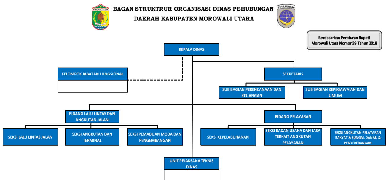
Gambar 1.1 Struktur Organisasi DISHUB Kabupaten Morowali Utara