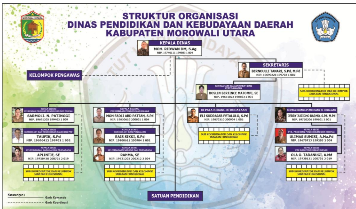
BAGAN 1: STRUKTUR DINAS PENDIDIKAN DAN KEBUDAYAAN DAERAH

Di samping itu Dinas Pendidikan dan Kebudayaan Daerah Kabupaten Morowali Utara terdapat 10 (sepuluh) Unit Pelaksana Teknis Dinas yang tersebar disetiap Kecamatan.